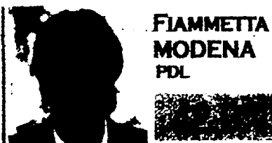
FIAMMETTA MODENA PDL